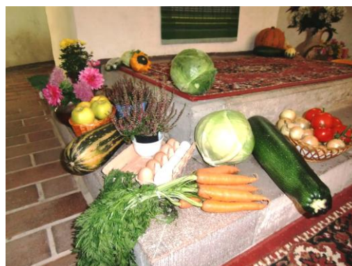
Erntedankgaben vor dem Altar