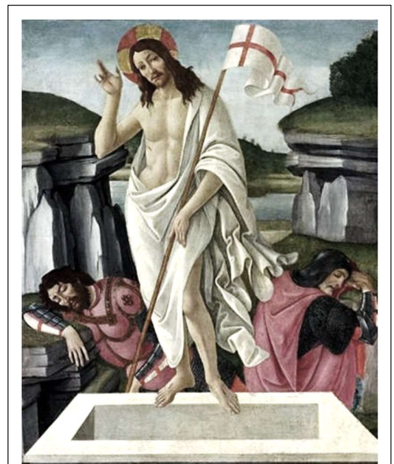
Sandro Botticelli: Die Auferstehung (1490)

Die Antwort auf die grundsätzliche Frage, ob eine Auferstehung von den Toten überhaupt möglich ist, hängt letztlich damit zusammen, ob wir zulassen, dass es auch Dinge gibt, die sich nicht der menschlichen Erkenntnis voll und ganz erschließen. Der Glaube ist damit anders zu bewerten als objektive Wissenschaft. Beim Glauben kommt es auf das subjektive Empfinden an, was wahr sein kann und was nicht. Für den Glaubenden ist die Auferstehung ein Wunder, ein Eingreifen Gottes in unsere Welt. Es muss für den menschlichen Verstand nicht nachvollziehbar sein, wohl aber für das Herz. (MW)